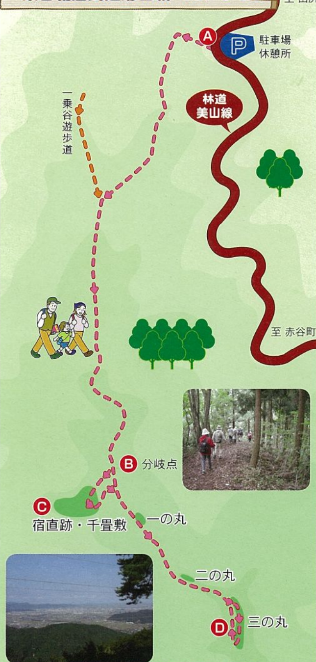
宿直跡・千畳敷から福井平野の眺望