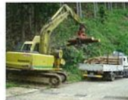
林道からの木材積み込み

森林は光合成により、大気中の二酸化炭素を吸収・固定して成長します。間伐をすることで、木が大きくなり成長できるようになり、伐った木材も、エネルギー負荷の少ない環境に良い資材として使用できます。