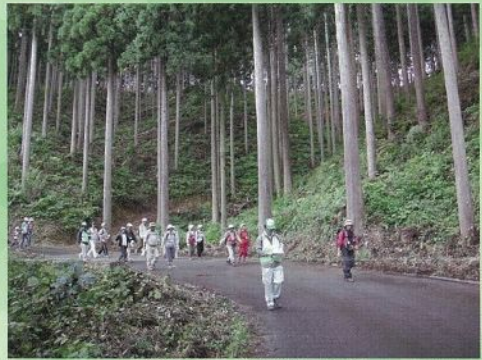
林道沿線の足羽杉の美林