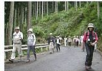
林道ウォーク開催